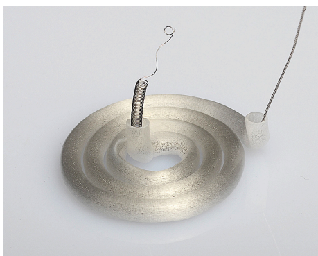
Готовые к использованию сборки из кварцевого стекла