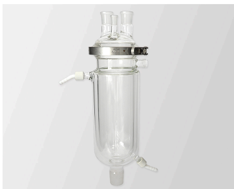
Реакторы из кварцевого стекла