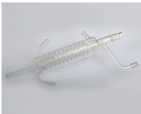
Охладитель из кварцевого стекла