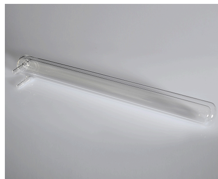
Двойные стенки трубок из кварцевого стекла